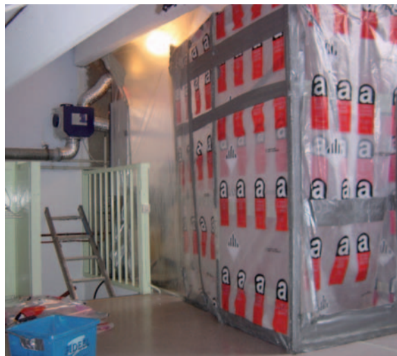
De Donk Den Bosch

De regels voor het verwijderen van specifiek benoemde asbesthoudende materialen zijn, door de indeling in risicoklassen, enigszins versoepeld. Het kabinet heeft inmiddels het voorstel daartoe van de staatssecretaris goedgekeurd. Als asbestverwijderingsbedrijf en als lid van de VVTB zijn wij niet tegen de versoepeling van de voorschriften om asbest te verwijderen, maar willen er voor pleiten dit te laten doen door gecertificeerde bedrijven.