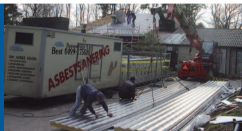
Asbestverwijdering en dakrenovatie