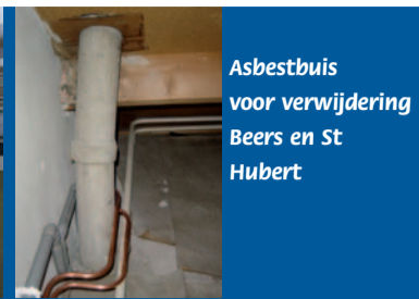
Asbestbuis voor verwijdering Beers en St Hubert