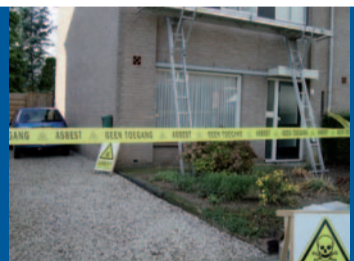
Renovatie Beers en St Hubert