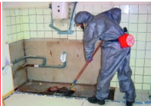
Asbestverwijdering onder strenge voorzorgsmaatregelen

In 80 procent van de gebouwen van voor 1990, vooral oudere panden en woningen, zit asbest verwerkt. Asbest mag in de meeste gevallen alleen met toestemming van de gemeente door deskundige en gecertificeerde bedrijven worden opgeruimd. Fideel Bouwservice B.V. heeft zich in het verwijderen van asbest gespecialiseerd. Met de grootste zorg en volgens de strenge regels die de overheid heeft vastgesteld zorgen de gediplomeerde medewerkers van Fideel Bouwservice, onder leiding en toezicht van een Deskundig Toezichthouder Verwijdering Asbest en Crocidoliet (DTA-A), voor een risicovrije verwijdering van het gevaarlijke materiaal uit woningen, constructies, grond en puin.