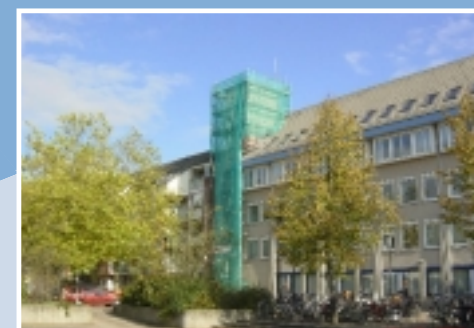
Onderhoud gebouwen / gevelreiniging

Wij werken volgens de normen van de Arbodiensten en onze eigen VGW-plannen. Onze medewerkers staan er om bekend dat zij zich zonder problemen aanpassen bij renovatieprojecten in bewoonde staat. De zorg voor de bewoners en de woning staat centraal. Wij worden met name door woningstichtingen, overheden en aannemersbedrijven bij grote renovatieprojecten betrokken. Onze gespecialiseerde medewerkers behandelen muren ter voorkoming van vochtproblemen, verrichten betonreparaties en hak- en freeswerk, reinigen en vernieuwen het voegwerk van gevels en brengen antigriffiticoatings aan.